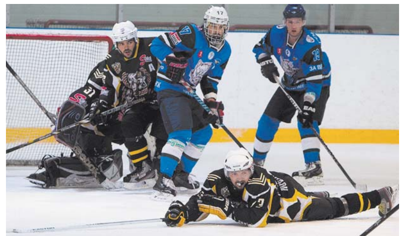
Бои на холодном льду бывают очень жаркими.

И, несомненно, главным достижением нашей команды являются болельщики. Могу точно сказать, что такой поддержки нет больше ни у одной любительской команды города. И, пожалуй, это главный показа-